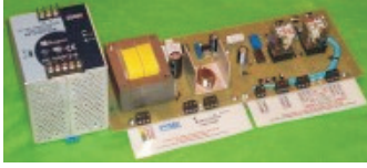
Imagen de Componente:

Placa tipo "Open Frame" con montaje sobre riel din que permite mejor ventilación y la fuente asociada.